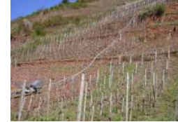
Monorackbahn im Steilhang

erledigt werden; die Zahl der Arbeitsstunden pro Hektar liegt um ein vielfaches höher als in Flachlagen, die maschinell bewirtschaftet werden können. Kleine Einschienenbahnen für den Transport von Arbeitskräften und Material